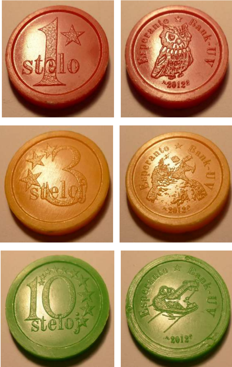
Plastaj Steloj 2012