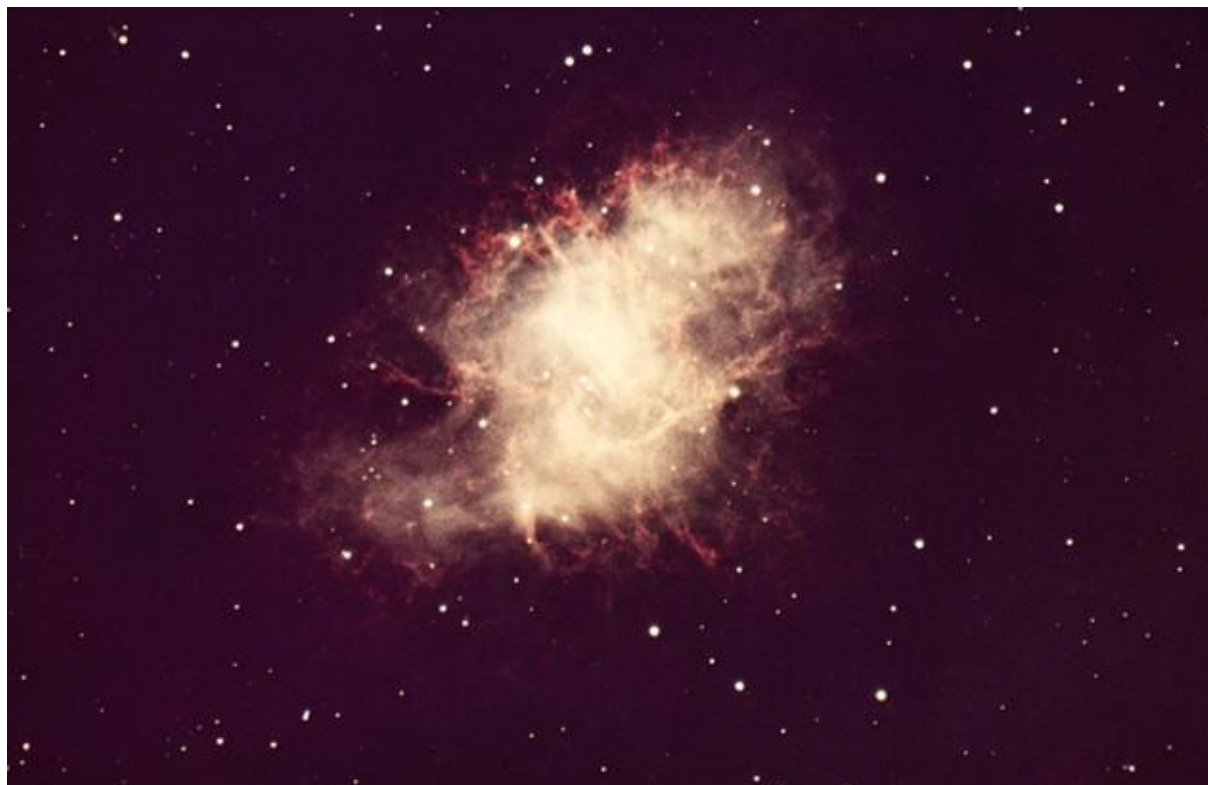
bildo 3 : la supernovaa nebulozo de la krabo