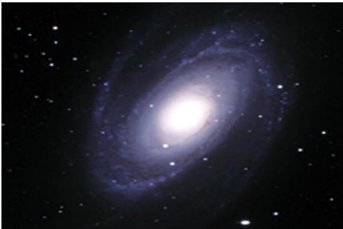
bildo 1: spirala galaksio

La blankeca strio tra la ĉielo, kiun ni nomas "Lakta Vojo", nia Galaksio, konsistas el steloj. Ili estas tiom multnombraj kaj tiom malproksimaj ke ili ne estas disigeblaj nudokule. Ni estas parto de grandega spirala disko, kiu konsistas el miliardoj da steloj, sed de nia vidpunkto, en la disko, ni vidas ĝin kiel strio, aŭ lakteca pado. Tamen, nia Galaksio konsistas ne nur el steloj. Verŝajne eĉ ne plejparte el steloj : kvankam steloj produktas plejparton de la lumo de la Lakta Vojo, ekzistas ankaŭ gaso, nebulozoj, planedoj aliaj objektoj, sed la pli granda parto estas en formo de " malhela materio".